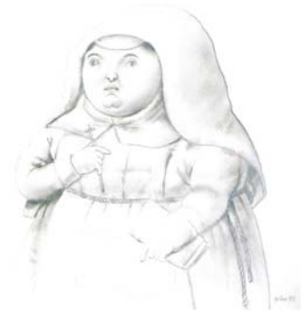
Fernando Botero (Colombia) A Nun , 1998.

El MAC- Lima nace con lineamientos claros y precisos.