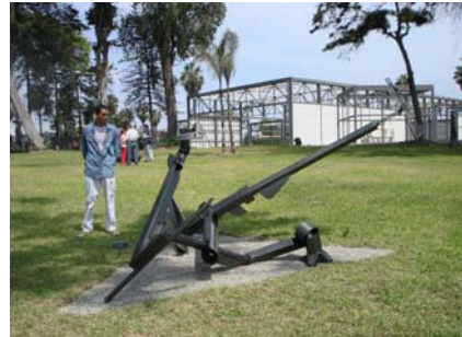
Jardín de esculturas. MAC-Lima

La misión del MAC-Lima, se traduce en beneficiarios concretos . El MAC-Lima es para todos los barranquinos, limeños, peruanos y visitantes extranjeros. Es nuestro objetivo convocar a la mayor cantidad de personas buscando ser un verdadero espacio para el arte actual que promueva la imaginación, invite a conocer y soñar . El MAC-Lima se adhiere a la definición de museos del ICOM y sabe que como institución museística se encuentra al servicio de la sociedad.