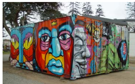
El Codo, Pésimo y Ente Contenedor-graffiti, 2007.