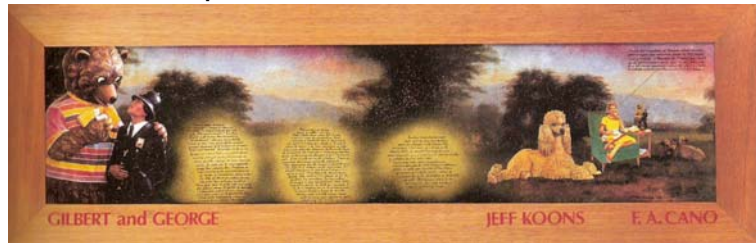
Álvaro Barrios (Colombia) Oh Arte Quién eres Tú, 1998.

El MAC-Lima contará con exposiciones de carácter semi permanente y temporal. Las exposiciones se basarán en curadurías trabajadas desde el museo, por invitación a curadores externos (nacionales y extranjeros), por intercambios expositivos con otras instituciones artísticas y por la captación de exposiciones de itinerancia internacional.